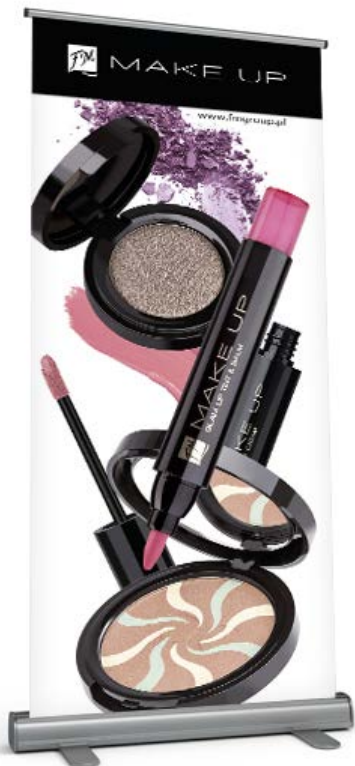
ROLL-UP FM GROUP MAKE UP