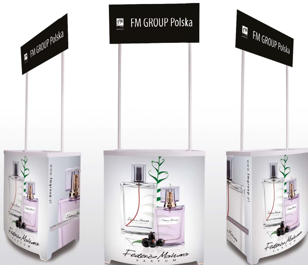
STOISKO DO PREZENTACJI FM GROUP ▼

Stoiska promocyjne dla Dystrybutorów to niezastąpione narzędzia promocyjne. Umożliwiają efektowną prezentację produktów. Dzięki wygodnej torbie są niezwykle łatwe do przetransportowania.