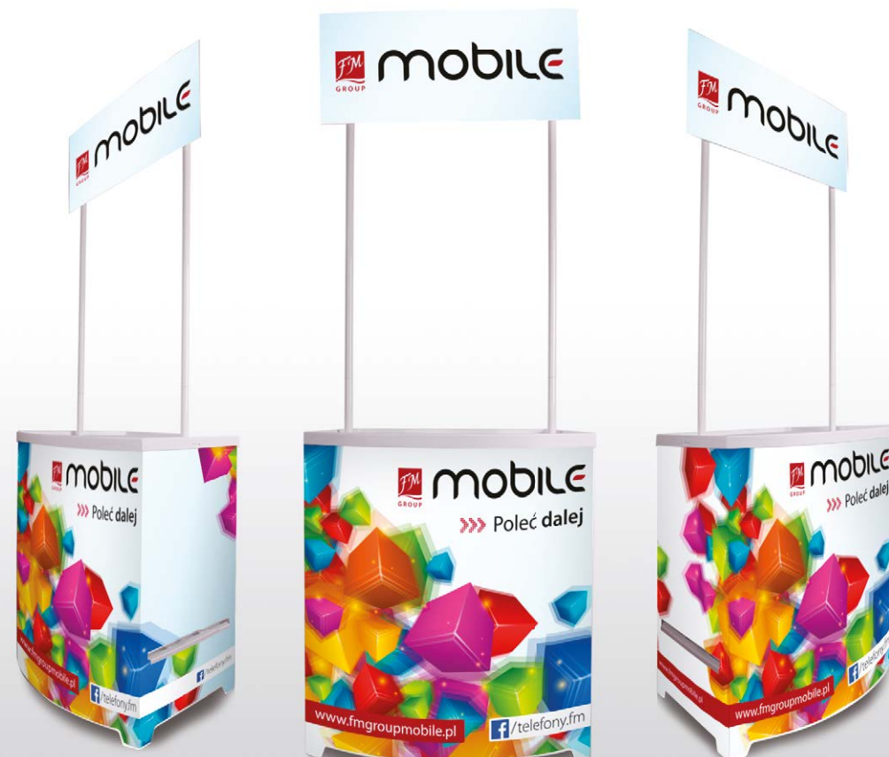
STOISKO DO PREZENTACJI FM GROUP Mobile ▼