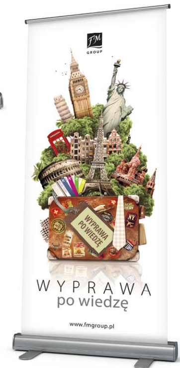
ROLL-UP FM GROUP Wyprawa po wiedzę