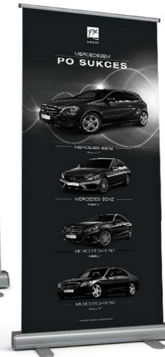
ROLL-UP FM GROUP MERCEDESEM PO SUKCES