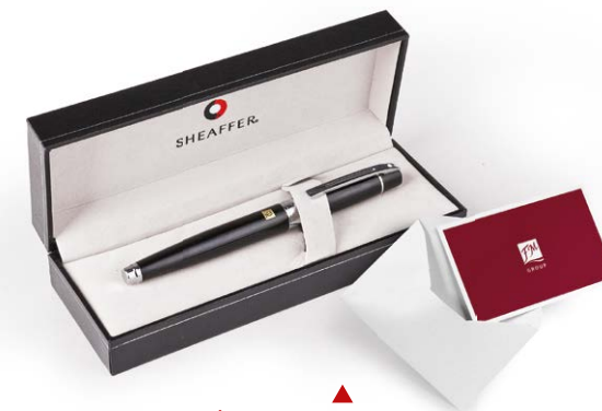
▶ PIÓRO KULKOWE Z GRATULACJAMI