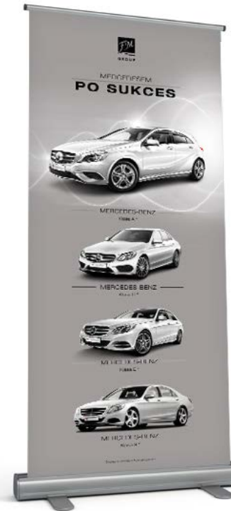
ROLL-UP FM GROUP MERCEDESEM PO SUKCES