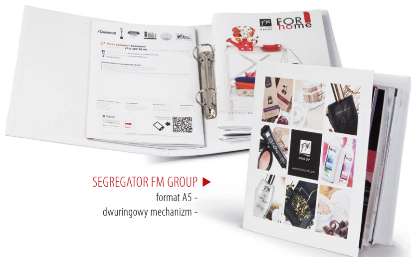
SEGREGATOR FM GROUP ▶ format A5 - dwurungowy mechanizm -